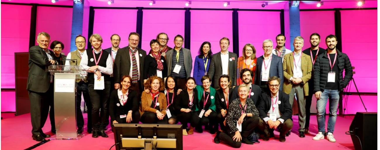
Photo de famille en clôture du CIM